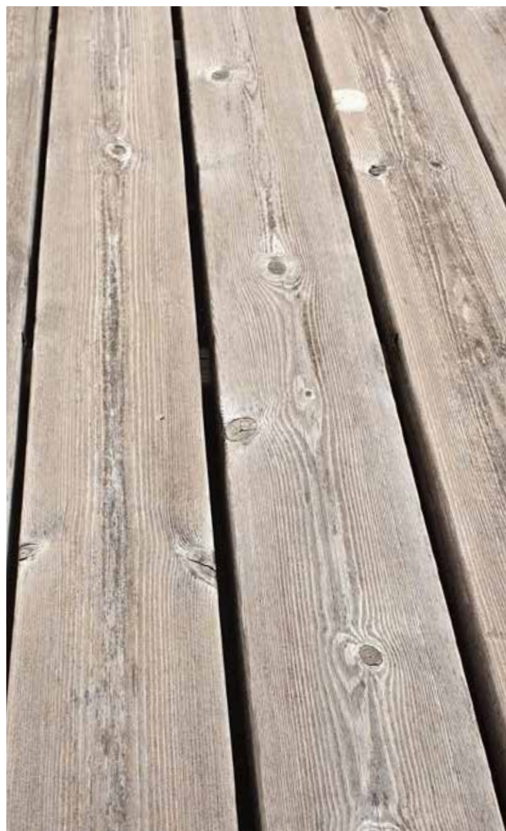
Terrassendeck aus Kebony Character, 3-jährig (Bild 2022)

Kebony Character, inkl. Kebony-Unterkonstruktion und Befestigungsmittel zur verdeckten Montage