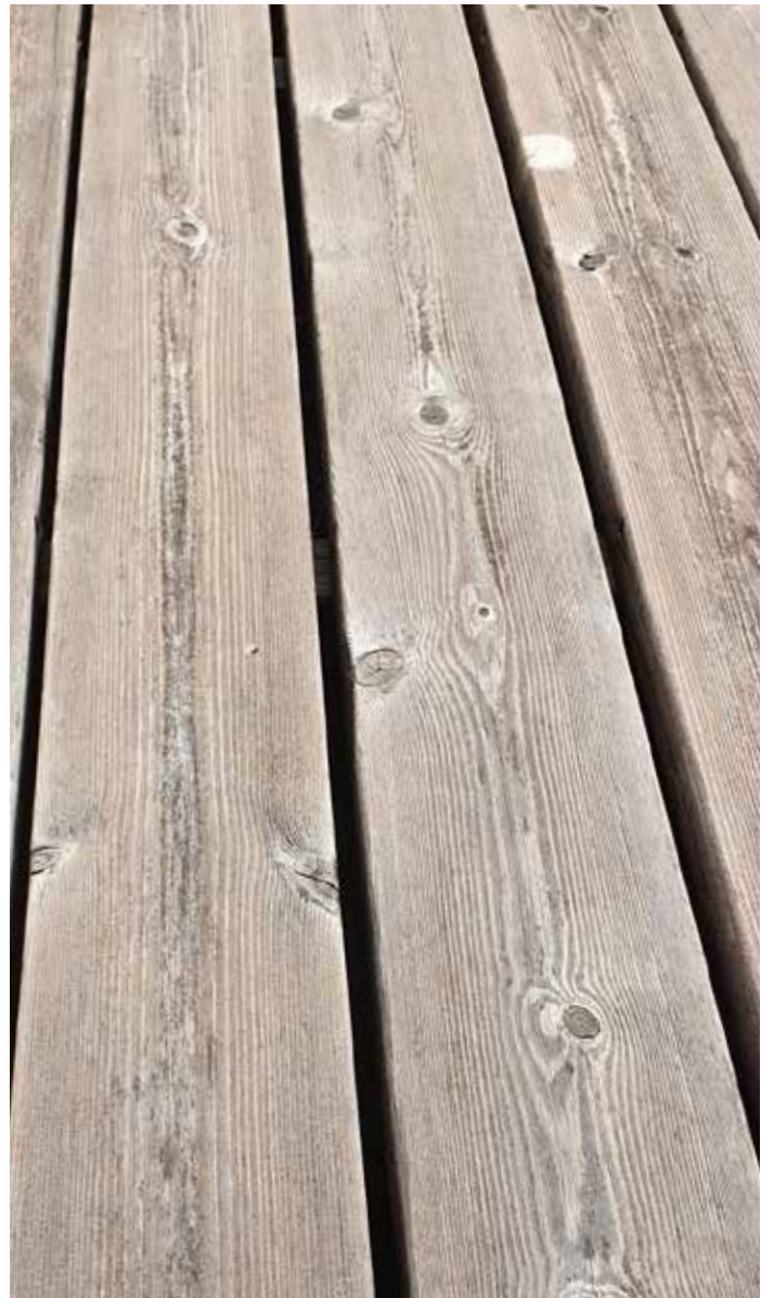
Terrassendeck aus Kebony Character neu verlegt (Bild links, 2019) und nach drei Jahren (Bild rechts, 2022)