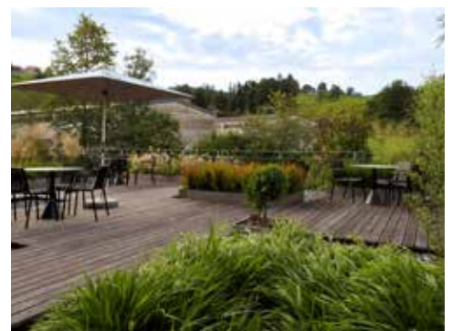
Das Terrassendeck aus Kebony Character nach einem Jahr Bewitterung im 2020. Durch Sonne und Regen hat das Holz bereits eine natürliche, leicht silbergraue Patina.