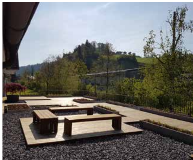
Das Terrassendeck aus Kebony Character, fotografiert 2019 kurz nach der Montage.