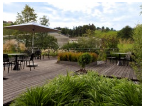
Le revêtement de terrasse en Kebony Character après une année d'exposition aux intempéries en 2020. Le soleil et la pluie ont déjà donné au bois une patine naturelle légèrement gris argenté.