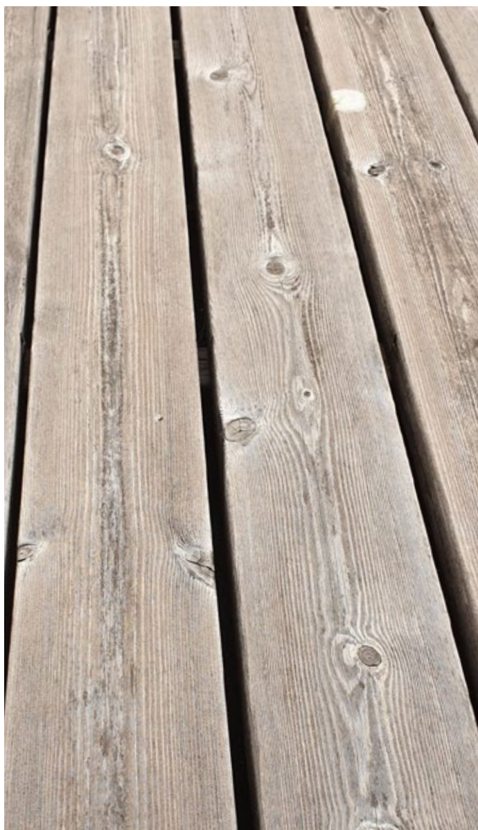
Terrasse en Kebony Character nouvellement posée (photo de gauche, 2019) et après trois ans (photo de droite, 2022)