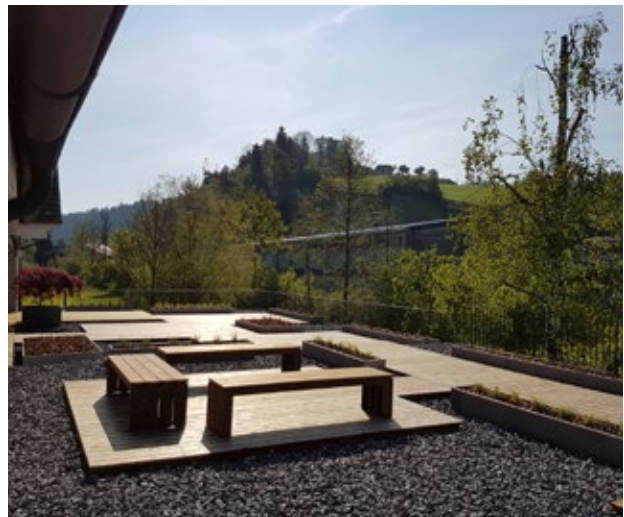
La terrasse en Kebony Character, photographée en 2019 peu après le montage.