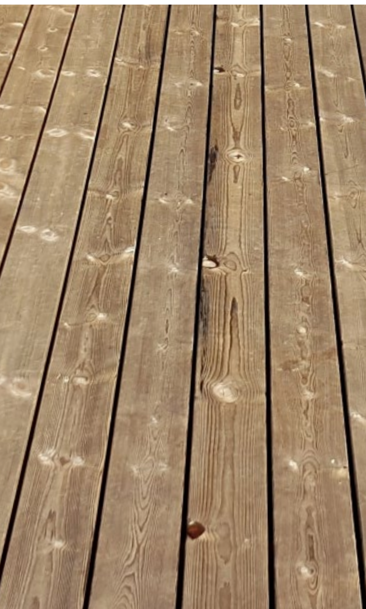
Deck de terrasse en Kebony Character nouvellement posé (photo 2019)