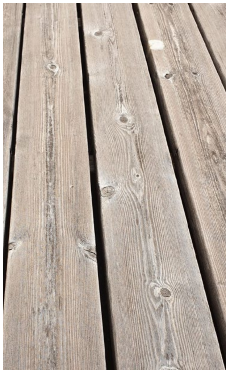
Deck de terrasse en Kebony Character, 3 ans (photo 2022)

Kebony Character, y compris sous-construction Kebony et matériel de fixation pour montage invisible